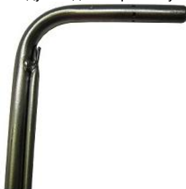
Наконечник трубки Пито с термопарой