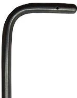
Наконечник трубки Пито

Трубка напорная модификации Пито с термопарой предназначена для работы в комплекте с дифференциальными манометрами ДМЦ-01М, имеющими канал автоматического ввода температуры. При измерениях скорости и объемного расхода газопылевых потоков такими комплектами отпадает необходимость измерения температуры потока дополнительным термометром и ввода значения в память ДМЦ-01М вручную. Концы трубок напорных соединяются с дифференциальным манометром шлангами (силиконовыми, ПВХ, резиновыми) (приобретаются дополнительно) необходимой длины. Трубка напорная устанавливается в отверстие в стенке воздуховода на прямом участке.