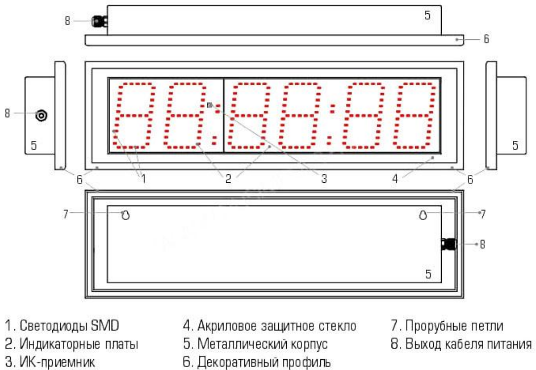
Рис. 2. Типовой чертеж офисных электронных часов Импульс-431-HMS

Примечание: расположение выводов кабелей питания, проводов датчиков и иных конструктивных элементов может меняться в зависимости от модели.