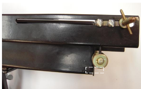
Датчик начала поворота управляемого колеса