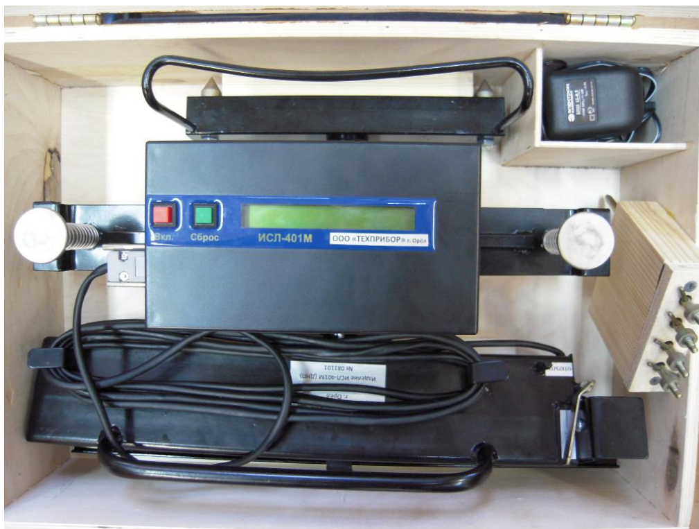
Рисунок 1. Фотография общего вида прибора в укладочной таре.