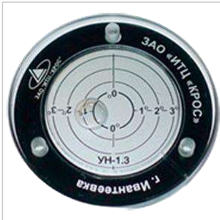
Указатель угла наклона УН-1.3