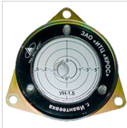
Указатель угла наклона УН-1.5К