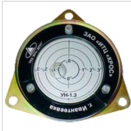
Указатель угла наклона УН-1.3К