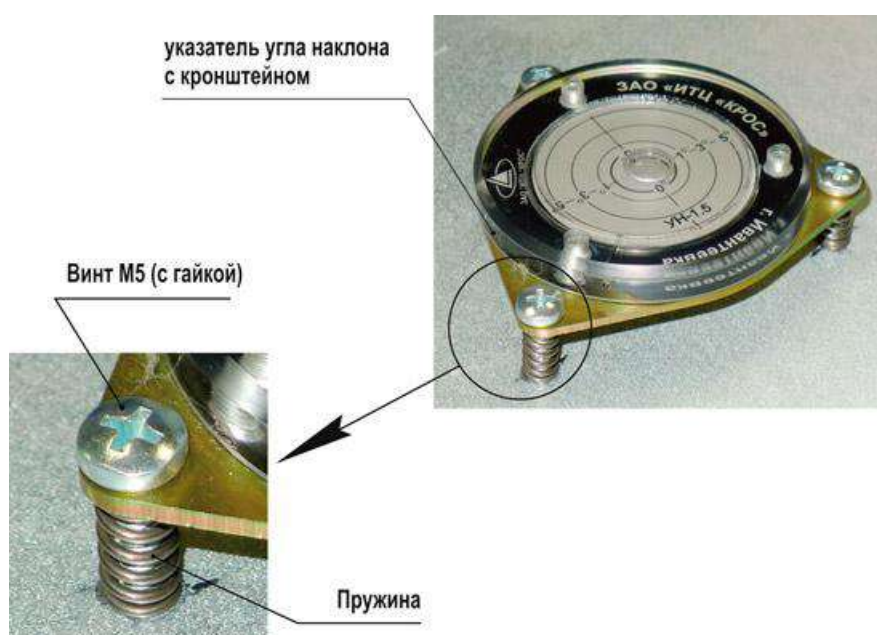
Рис. 1. Монтаж указателя с кронштейном на винты с пружинами