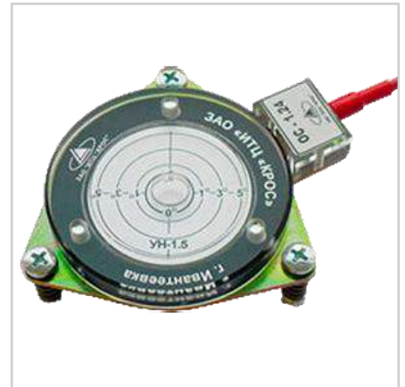
Указатель угла наклона УН-1.5КП