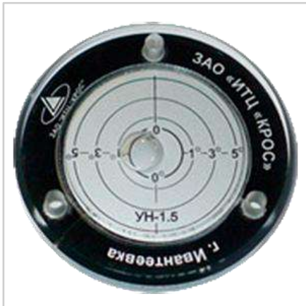
Указатель угла наклона УН-1.5