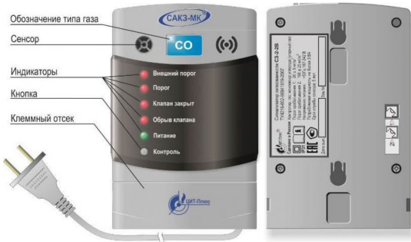
Рис1. Сигнализатор С3-2-2В