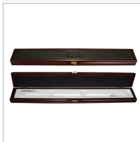
ППО в футляре (кожа-дерево)