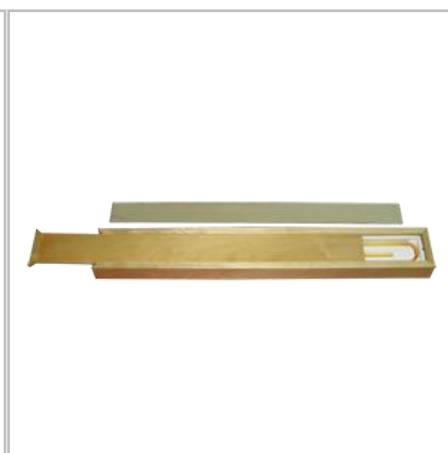
ППО в пенале (дерево)