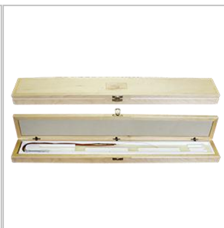
ППО в футляре (дерево)