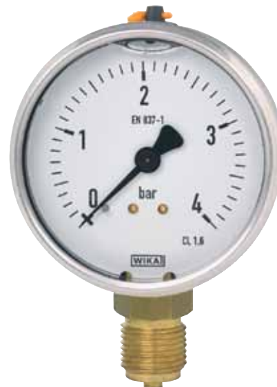
Манометр с трубкой Бурдона модель 113.53