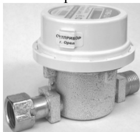
Рисунок 1 – Общий вид счетчиков

Схема пломбировки счетчиков приведена на рисунке 2.