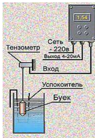
Рис. 2. Монтаж